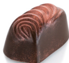
ARANCIA & CANNELLA

35% White chocolate, cream, absinthe, glucose syrup