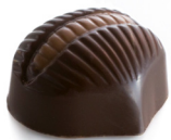
MARRONI & RUM 12Y

Ciocolato fondente monorigine Venezuela 72%, panna , pasta marroni, sciroppo glucosio, rum 12 anni