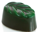
MENTA PIPERITA E CITRONELLA

72% Single origin Venezuela dark chocolate, cream , chestnut cream, glucose syrup, rum 12 years