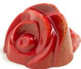
ROSA &amp; TÈ

White chocolate 35%, cream , hazelnut, glucose syrup, Ligurian extra virgin olive oil, pink salt